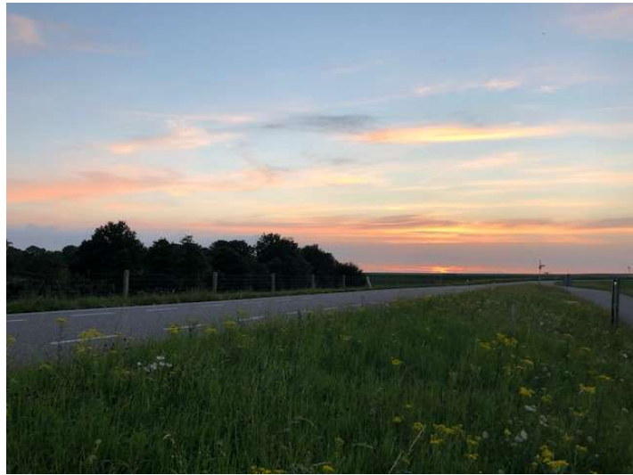
Tekst en foto's: Ellen van Knippenberg